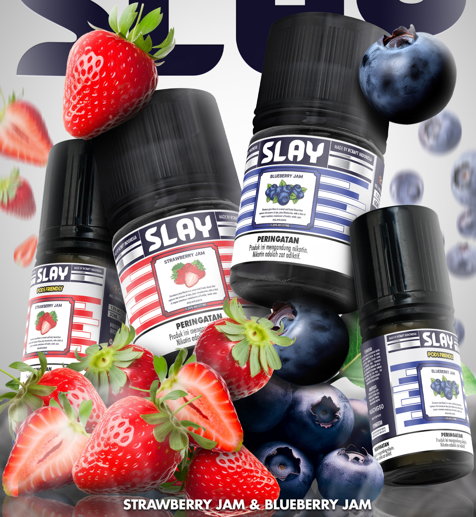
STRAWBERRY JAM & BLUEBERRY JAM